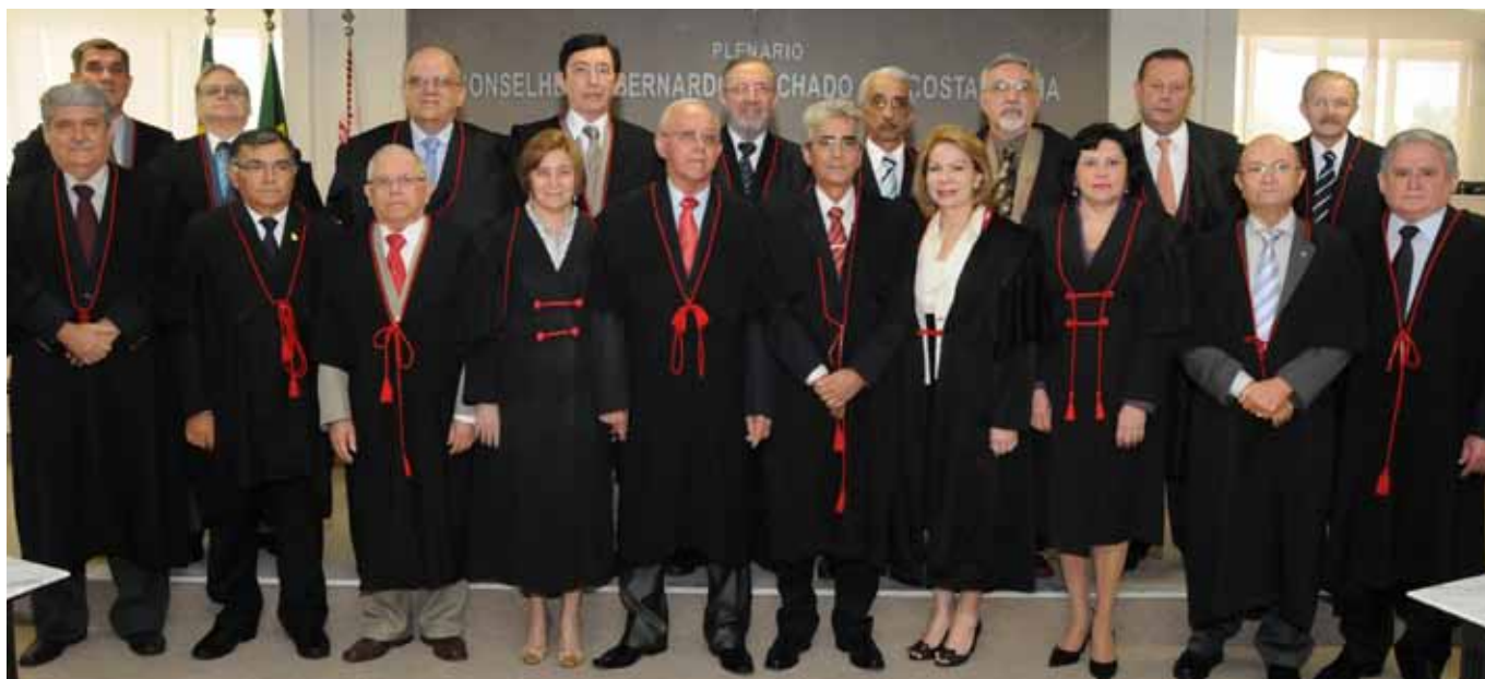
Desembargadores integrantes do Órgão Especial