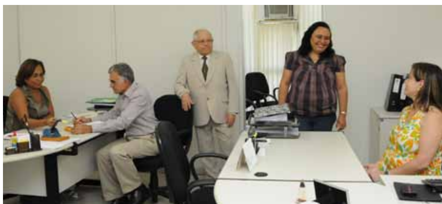
Desembargador Francisco Auricélio Pontes é o ouvidor do TJCE

aos setores competentes, sobre as manifestações recebidas, bem como foram feitas solicitações de providências, pedidos de informações, comunicando elogios, sugestões e efetivando as demais diligências necessárias ao bom cumprimento das atividades.