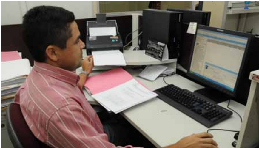
Mais de 220 mil processos tramitam de forma virtual na Comarca de Fortaleza

A Secretaria de Tecnologia da Informação do Tribunal de Justiça do Ceará (TJCE) vem implantando melhorias no Sistema de Automação da Justiça (SAJ). O objetivo é facilitar o uso do software pelos operadores do Direito.