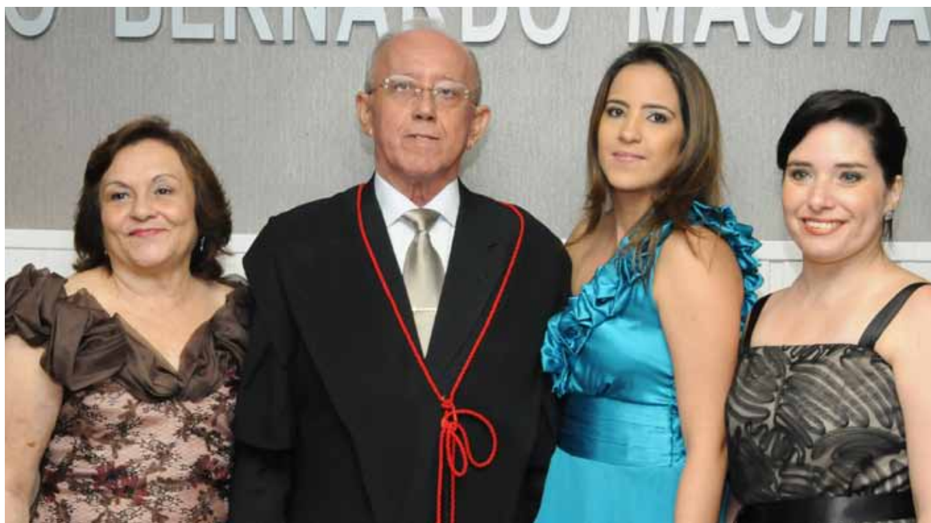
Ao lado da esposa e filhas durante posse como presidente do Tribunal

características transparentes de dedicação, integridade e firmeza, é um exemplo a todos que compõem a sua equipe. A confiança concedida é resultado de trabalho intenso e permite fortalecer o desempenho de todos”.