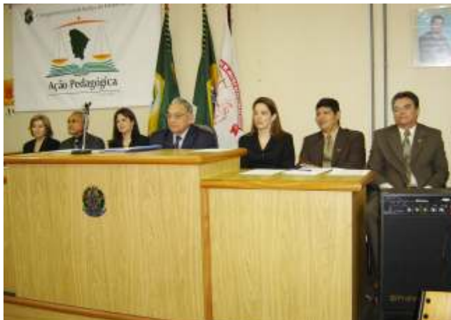
Abertura do terceiro ciclo em Caucaia reuniu autoridades

Mais de 110 pessoas participaram do projeto Corregedoria em Ação Pedagógica, que deu início ao terceiro Ciclo de Correições, Inspeções e Visitas da Corregedoria Geral da Justiça do Estado do Ceará. Dentre os participantes, 36 juízes de 41 comarcas (algumas são vinculadas); 31 cartorários; diretores de secretaria dos fóruns, além de palestrantes, advogados e membros do Ministério Público.