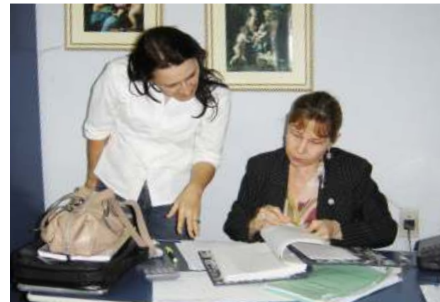
Auditoria esteve presente em 99 comarcas em 2005